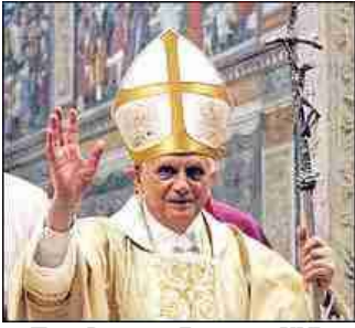
Папа Римский Бенедикт XVI

Среди всех вышеуказанных отступлений Римско-католической Церкви от Православной центральное место занимает догмат о папском главенстве . Сами папы и их приверженцы признают его за основу католицизма. По общему сознанию православных богословов, именно этот догмат, как краеугольный камень, на котором зиждется все здание папства, и обуславливает собою особенный характер всего устройства Римско-католической Церкви со всеми ложными учениями ее вероисповедной системы. Очевидная несообразность этого догмата с основными началами истинного христианского веро- и нравоучения служила главной причиной появления в Римско-католической Церкви ересей, расколов и целого ряда движений, в той или другой мере нарушавших единство Римско-католической Церкви, подрывавших ее авторитет и наносивших ей явный ущерб. Хотя несомненно, что все это, а равно и всякие другие ненормальности, неизбежные в Римско-католической Церкви при признании папского авторитета, как вмещающего в себе будто бы всю полноту христианского ведения, останутся в полной силе до тех пор, пока римский католицизм будет оставаться тем, чем он есть; но папство и поныне, как и прежде, считает себя непогрешимым и с исключительным упорством продолжает отстаивать целостность и неприкосновенность своего абсолютизма, превращающего духовное царство Божие в царство папское 12 .