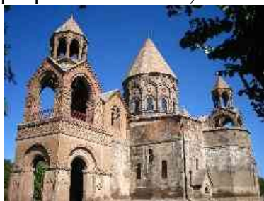
Собор в Эчмиадзине

Часть армян сблизилась с римско-католической церковью и под именем армяно-католиков состоит в подчинении папе. Армяне грегорианского исповедания, живущие в пределах Турции, подчинены константинопольскому армяно-грегорианскому патриарху; живущие же в пределах Персии и России состоят в ведении эчмиадзинского патриарха. Но этот последний патриарх считается главою всех армян грегорианского исповедания и имеет титул католикоса (ведущий свое начало со времени армянского митрополита Нерсеса I, впервые присвоившего себе этот титул всеобщего патриарха около 381 г.).