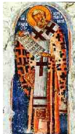
Святитель Григорий Армянский, Икона XIV в., Греция

грегорианская церковь в России делится на шесть епархий: Нахичеванскую и Бессарабскую, Астраханскую, Эриванскую, Грузинскую, Карабагскую и Ширванскую. Для образования армяно-грегорианского юношества в науках богословских учреждены при Эчмиадзииском