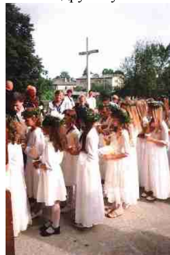
Праздник конфирмации в Карсавском костёле на Elijās (день св. Ильи – 20. 07. 2008 г.). Латвия. Латгальцы-католики.

Относительно разрешения грехов в таинстве покаяния Римская Церковь учит, будто это разрешение дается неполное и что после отпущения греховной вины и вечных наказаний на грешнике остается еще некоторый долг, для погашения которого он должен принести за грехи свои удовлетворение правде Божьей; вследствие этого Римская Церковь и на епитимии смотрит не как на исправительные и врачебные средства, а как на наказания для удовлетворения правде Божьей. Это удовлетворение совершается двояко: его приносит или сам грешник за себя, исполняя епитимию, или через других — усвоив себе излишек заслуг Христа и святых Его, индульгенции; кто же не успеет принести этого удовлетворения за себя (лично или через других) здесь на земле, тот должен будет принести его за гробом, в чистилище.