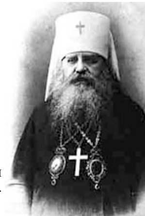
Митрополит Антоний (Храповицкий) (1863-1936)

Христианство есть подвиг добродетели; христианство есть жемчужина, для приобретения которой благоразумный купец Евангелия должен был распродать все свое имущество. Исторически под этим самоотверженным решением, под взятием креста разумелись различные подвиги: во время земной жизни Спасителя — вступление в число учеников, следовавших за Ним; далее — исповедание веры и мученичество; затем, от 4-го века и по 20 — отшельничество и монашество. Однако, эти разные виды подвига были лишь условиями одной идеи, одной цели — постепенного достижения на земле духовного совершенства, т.е. свободы от страстей, или бесстрастия, и обладания всеми добродетелями. “Сия есть воля Божия