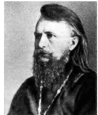
Протоиерей Сергей Булгаков (1859-1932)

Отделившись от Восточной Церкви и начавши жить жизнью особой, в себе замкнутой, Западная Церковь все более отступала от чистоты христианского вероучения и все более и более вносила нововведения и новшества в церковную жизнь. Особенно много таких нововведений в учении веры, в обрядах церковных и иерархическом устройстве произошло в средние века. Схоластическая наука привела эти отступления и нововведения в систему, обставила их разными доказательствами и закрепила в сознании католического мира. Позднейшие западные соборы придали этим нововведениям значение равное с догматами древней Вселенской Церкви. Таким образом, в Западной Церкви образовалась целая особенная система вероучений и церковного устройства. Дух властолюбия, все более и более развившийся в Западной Церкви, извратил в ней внутренние начала духовной жизни, начала свободной и братской любви, превратил ее из духовного царства Божия в царство мирское, принявшее в себя начала мирского государственного устройства и мирские государственные цели, интересы и стремления.