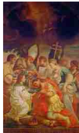
Крещение Трдата III Григорием Проветителем