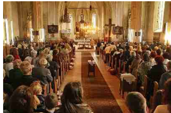
На богослужении в католическом храме.

Характер западной — итальянской живописи отличается от восточной — византийской. В западной иконописи, при большем изяществе внешней формы, менее духовной высоты и строгости христианской идеи. Там более дается места произволу художественной фантазии , чем у нас. У западных художников высокий, неземной мир святых людей изображается иногда слишком похожим на земной чувственный мир со всеми его волнениями и страстями. Кроме иконописных изображений, в западных церквях употребляются также и пластические