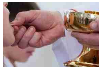
Первое причастие детей в Католической церкви