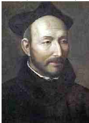
Игнатий Лойола, Основатель ордена иезуитов

Преследуя свою цель — подчинить волю католика внешнему, якобы непогрешимому, божественному авторитету в лице папы и сделать из неё вполне послушное орудие папской воли, иезуиты стали заботиться не о том, чтобы духом евангельского закона возбудить и усилить нравственное чувство в римских католиках до того, чтобы при его помощи и при свете Слова Божия они могли чувствовать и ясно сознавать, что в каждом акте их деятельности есть добро и что зло, что составляет их обязанность и что — грех, а о том, чтобы ослабить, угасить это чувство и заменить его различными внешними предписаниями, которыми бы, однако же, наилучшим образом достигалась цель ордена.